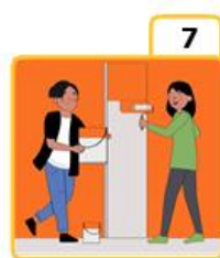
Help the neighbours