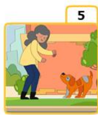
Feed stray dogs