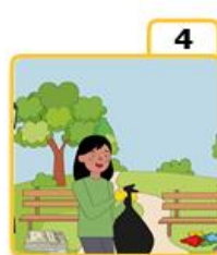
Take care of the environment