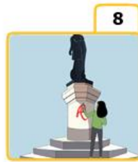
Destroy the monuments