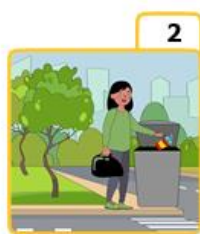
Put the garbage in the trash can