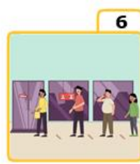
Wait your turn