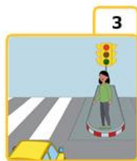
Respect the traffic lights